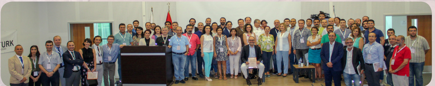
TURKIREBS 2017 (16 - 17 Eylül 2017, İstanbul)