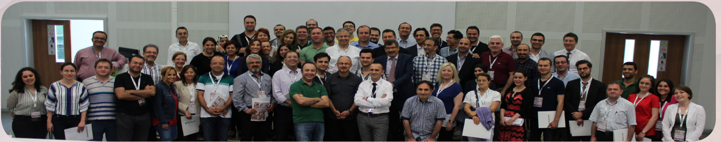
TURKIREBS 2016 (4 - 5 Haziran 2016, İstanbul)

Sınava girmeyen ya da sınavda başarılı olamayan kursiyerlere ise "Katılım" sertifikası verilecektir.